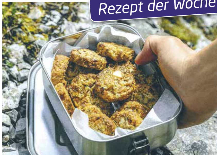
Power-Guetzli mit frischen Aprikosen.