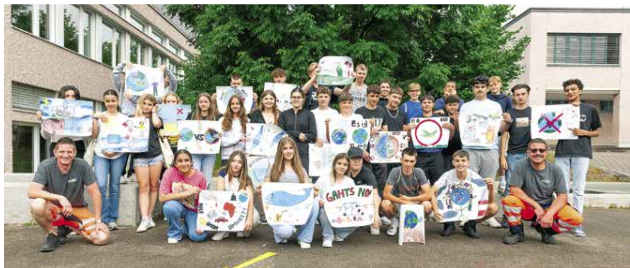
Schülerinnen und Schüler der zweiten Sek mit ihren selbst gestalteten Anti-Littering-Plakaten.