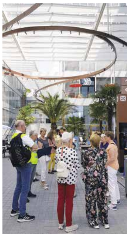
Hier befand man sich noch im öffentlich zugänglichen Teil der Anlage.

Die ganze Anlage ist autark (abgesenen Strom) und LEED-zertifiziert –