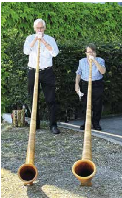
Die Alphörner sorgten für eine besondere Atmosphäre.

Mit einem sympathischen Interview, das eine Bewohnerin mit ihr führte, stellte sich «Ulla», wie sie von allen genannt wird, vor.