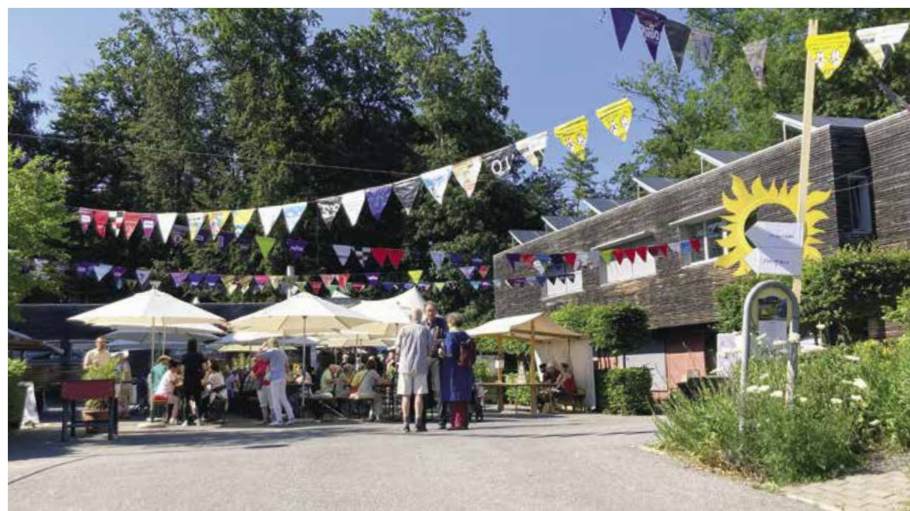
Gefeiert wurde bei allerschönstem Sommerwetter auf dem Festplatz.

Die Stiftung Stöckenweid feierte ihren 30. Geburtstag