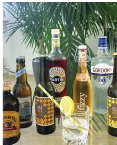
Wer hätte das gedacht: Diese coolen Drinks sind alkoholfrei.

Die Alkohol- und Suchtberatung Bezirk Meilen und die Suchtprävention des Samowar Meilen veranstalten am Mittwoch, 5. Juli zwischen 16 und 19 Uhr in Kooperation mit dem Coop Meilen eine alkoholfreie Degustation vor dem Eingangsbereich des Supermarkts. Geboten werden spritzige Getränke aus dem Sortiment des Coop. Bei einem Quiz rund ums Thema Alkohol kann man sein Wissen testen, am Glücksrad drehen und kleine Preise